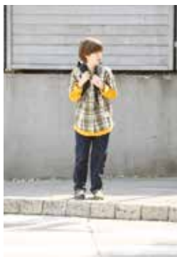
4. Še enkrat pogledam levo