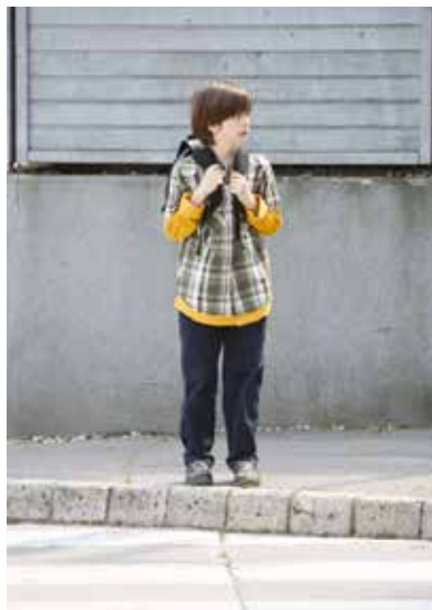
Šolar na pločniku