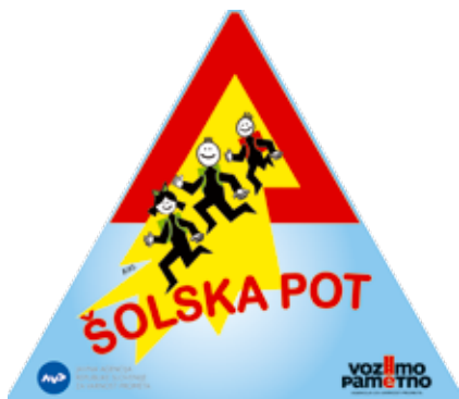
Prometni znak šolska pot (3502)

Pomemben prispevek na področju varnejših šolskih poti predstavlja tudi pravilno označevanje le teh z vertikalno in horizontalno prometno signalizacijo. V zvezi s tem je stopil v veljavo Pravilnik o prometni signalizaciji in prometni opremi, ki med drugim opredeljuje nov prometni znak »šolska pot«, ki mora biti postavljen skladno z načrtom šolskih poti na cesti oziroma njenem delu, kjer poteka šolska pot, izvedba znaka pa je dopustna tudi kot troznak ali zastava (pravokotni »beach flag«).