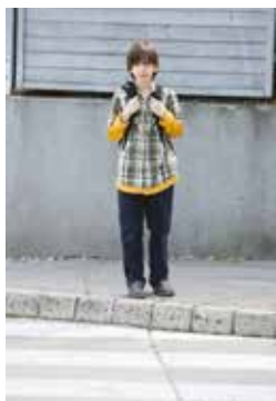
1. Ustavim se na robu pločnika

Potem, ko se prepričamo, da se otrok zna ustaviti ob robu pločnika in opazovati promet, začnemo z najtežjim delom, prečkanjem ceste. Prva prečkanja naj bodo na ozki, neprometni cesti. Poseben problem je, ker otrok ni sposoben ugotoviti razdalje in hitrosti vozil. Zato ga navajamo na to, da prečka cesto le, če z obeh strani ne prihaja nobeno vozilo ali takrat, ko voznik ustavi in mu jasno pokaže, da lahko prečka cesto.