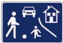
Območje umirjenega prometa

Policist je na cesti zato, da otrokom pomaga in jih varno usmerja v prometu. Grožnje, da ga bo videl ali celo kaznoval policist, če naredi kaj narobe, zato niso primerne.