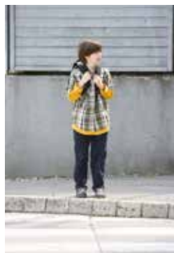
2. Pogledam na levo