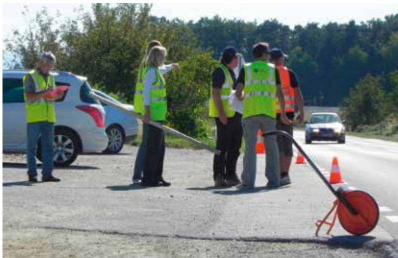
Terenska presoja varnosti šolskih poti

Ukrepi za varnejšo prometno infrastrukturo in večjo varnost otrok na šolskih poteh prinašajo dolgoročno tudi znatne prihranke lokalnih skupnosti na področju organiziranih šolskih prevozov, hkrati pa pripomorejo k učinkovitem in aktivnem vključevanju otroka oziroma šolarja v svet prometa.