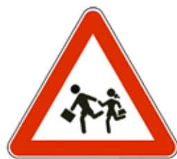
Otroci na cesti

Prometni znaki s svojimi barvami in simboli otroke vedno pritegnejo. Brez težav se naučijo njihova imena, več problemov pa imajo pri tem, kako je potrebno ravnati. Nekaj znakov otroke izredno moti in jih razumejo popolnoma narobe. Simbole si razlagajo po svoje in tako tudi ravnajo. Najbolj znan znak, ki spodbuja otroke k napačnem ravnanju, je znak Otroci na cesti, ki opozarja voznike, da prihajajo na območje, kjer so na cesti pogosto otroci. Zaradi simbola dveh otrok v teku pa ga otroci lahko razumejo tako, da je treba pri tem znaku steči čez cesto.