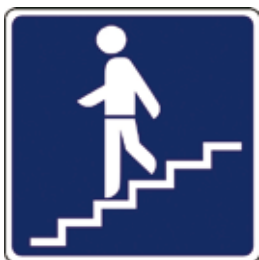
Podzemni prehod za pešce