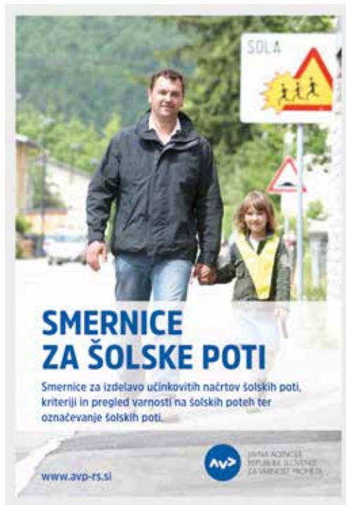
Strokovna publikacija AVP: Smernice za šolske poti

Javna agencija RS za varnost prometa je izdala smernice za šolske poti, ki predstavljajo koristen in uporaben pripomoček osnovnim šolam in lokalnim skupnostim za izdelavo učinkovitih načrtov, za celovitejši pregled in izboljšanje varnosti ter za poenoteno označevanje šolskih poti. Smernice za šolske poti med drugim usmerjajo k bolj sistematičnemu in koordiniranemu pristopu na področju prometne varnosti na lokalni ravni ter k varnejši cestno-prometni infrastrukturi.