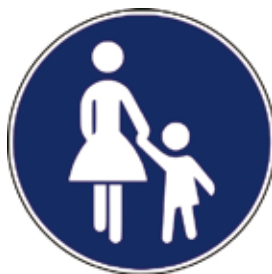
Steza za pešce

Otroci bi morali poznati predvsem prometne znake, ki pešce obveščajo o varni hoji, jim zapovedujejo ravnanje ali prepovedujejo hojo.