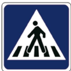
Prehod za pešce