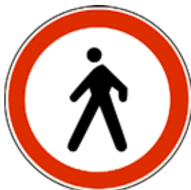
Prepovedano za pešce