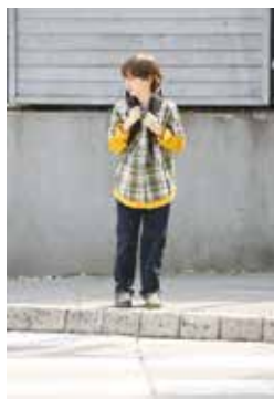
3. Pogledam na desno