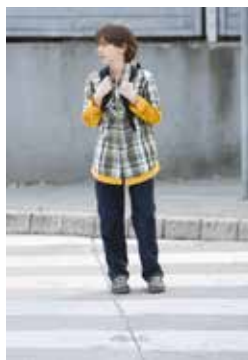
6. Na sredini ceste še enkrat pogledam na desno.